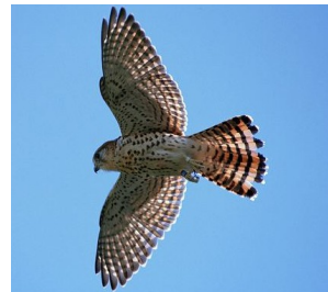
La crécerelle , oiseau endémique qui se nourrit de geckos, rongeurs , lézards et petits oiseaux.