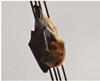
Rousette Noire chauve-souris endémique qui se nourrit de fruits.