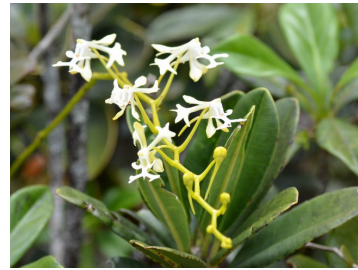
Orchidée épiphyte* . Elle s'accroche aux arbustes et aux arbres par ses nombreuses racines aériennes