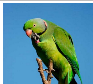
Grosse câteau verte , oiseau endémique qui se nourrit de plantes endémiques