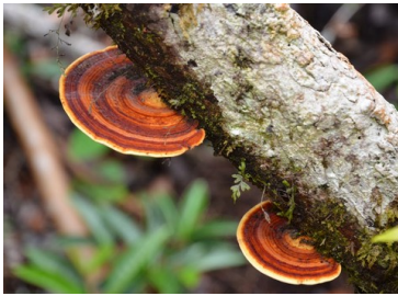
Champignons qui pousse sur du bois mort

* Symbiose : Relation permanente entre deux organismes d'espèces différentes et qui se traduit par des effets bénéfiques aussi bien pour l'un que pour l'autre.