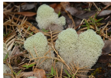
Lichens Les lichens sont des champignons qui réalise une symbiose* avec une algue verte.