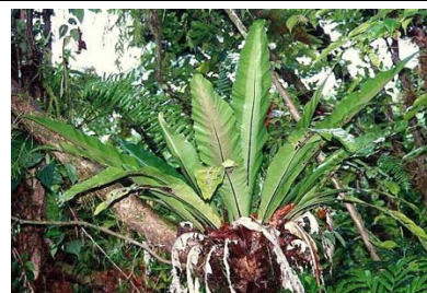
Fougère épiphyte*