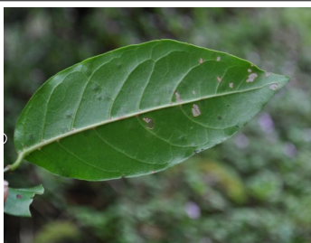
Bois bigaignon bâtard , espèce indigène qui présente de petits creux à l'aisselle des nervures, les domaties, dans lesquelles sont abrités des bactéries et des acariens qui vivent en symbiose* avec elle.