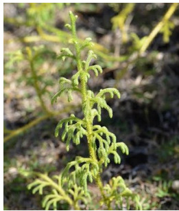
Un Lycopode sur le sol.