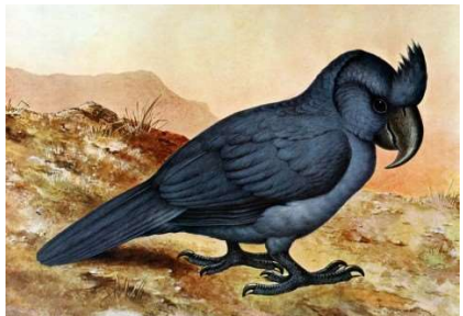
Le Perroquet bleu de Maurice : Lophopsittacus mauritianus

N'existe plus qu'en un seul exemplaire au monde au jardin botanique de Curepipe et ne se reproduit pas.