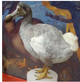
Le Dodo : Raphus cucullatus

* Une espèce endémique est une espèce animale ou végétale qui n'existe à l'état naturel que dans une région géographique particulière.